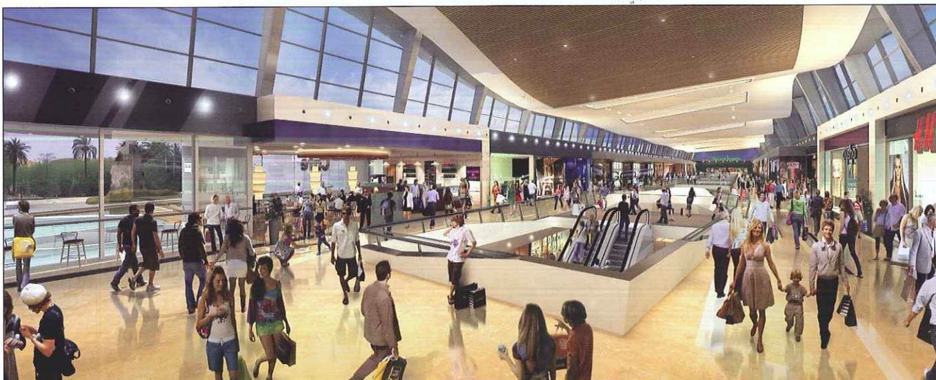
Infografía del interior del centro comercial Puerto Venecia.

Toys r' us. La explicación que ofrece Hodson es muy clara “unirse a operadores de la talla de El Corte Inglés e Ikea y otros líderes de su sector, es una oportunidad que ninguna marca quiere perder” . En total, el centro contará con más de 250 tiendas y operadores.