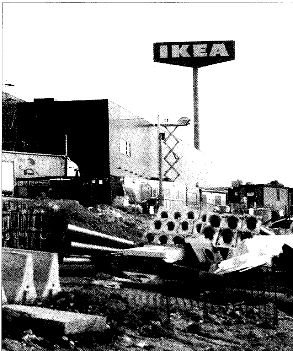
A la izquierda, Puerto Venecia. A la derecha, pasarela peatonal sobre el tercer cinturón.

Todas estas infraestructuras y mejoras no se quedarán aquí. El distrito tiene proyectos de futuro como la adecuación de la nueva cárcel de Torrero (en los próximos años), que constituirá un equipamiento completo y nuevo también para toda la ciudad de Zaragoza. ≡