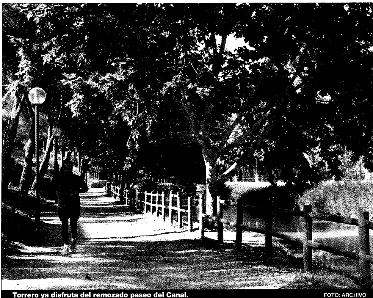
Torrero ya disfruta del remozado paseo del Canal.