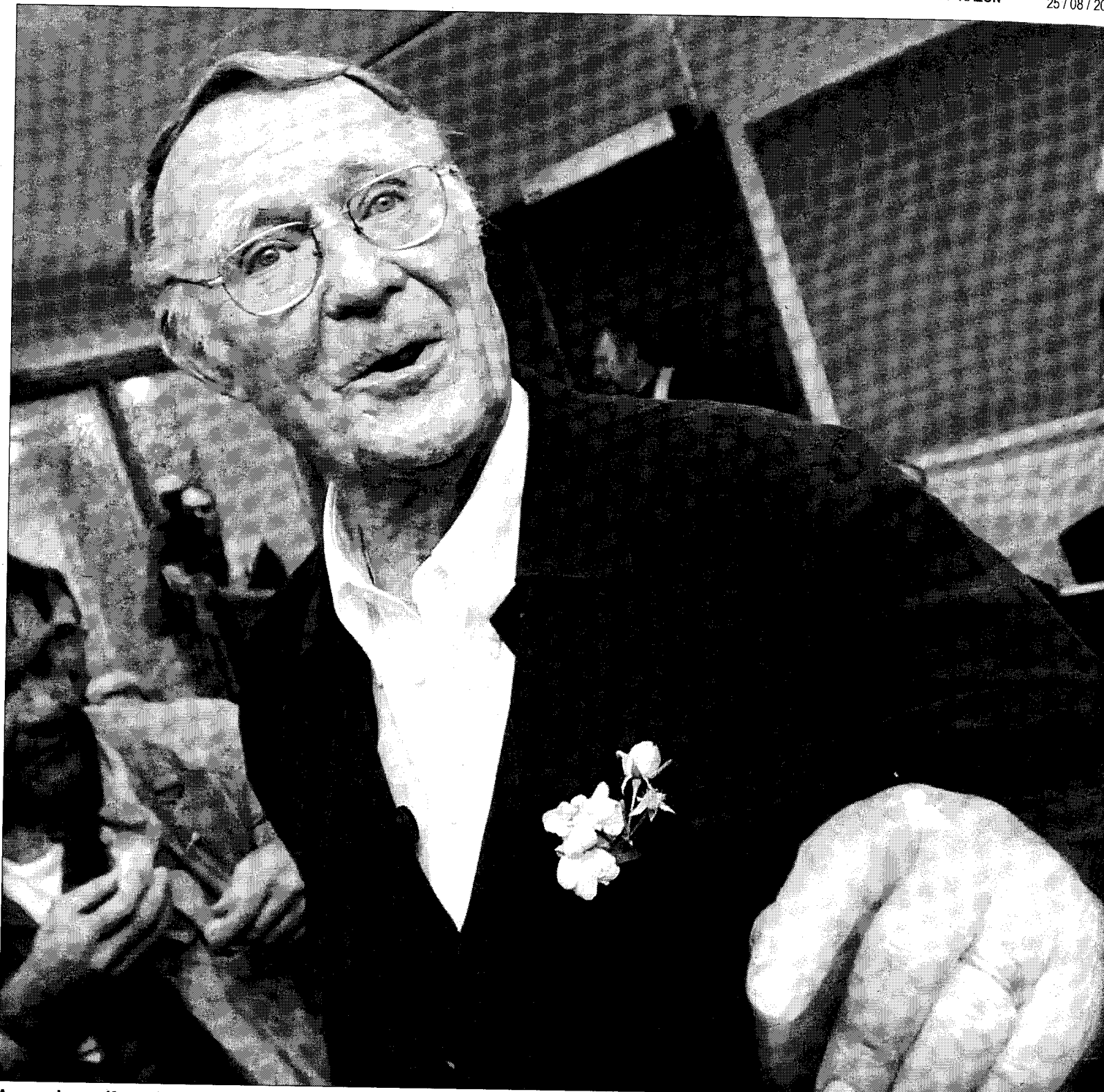
Aunque Ingvar Kamrad, el fundador de la empresa, vive en Suiza, vuelve a casa por Navidad todos los años para estrechar la mano de sus empleados

Lisa Nowak, la ex astronauta de la NASA, culpable de agredir a una compañera presa de los celos, testificó ayer ante el juez por primera vez. (Pág. 61)