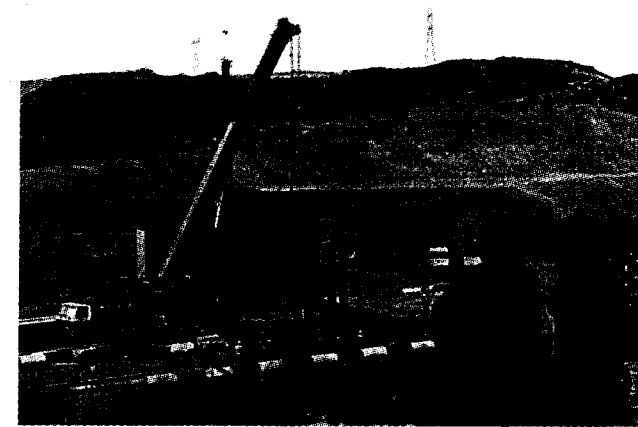
EXPECTACIÓN EN EL IZADO. Varios curiosos observaron la espectacular operación sobre el Cuarto Cinturón.