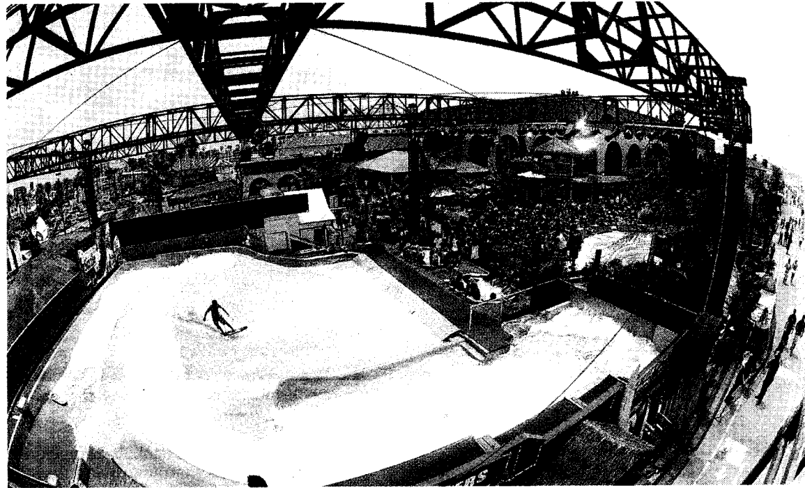
Imagen de uno de los cuatro complejos que Wave House tiene en el mundo.

Además de los clientes que entren para practicar el surf, las instalaciones tendrán una zona para conciertos con capacidad para más de 1.000 personas, un bar, un