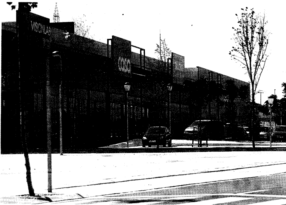
El parque de medianas de Puerto Venecia está finalizado y prácticamente ocupado en su totalidad. E.CASAS

La 'locomotora' de esta segunda fase será El Corte Inglés-Hiperco, que ya cuenta también con su licencia de obras para comen-